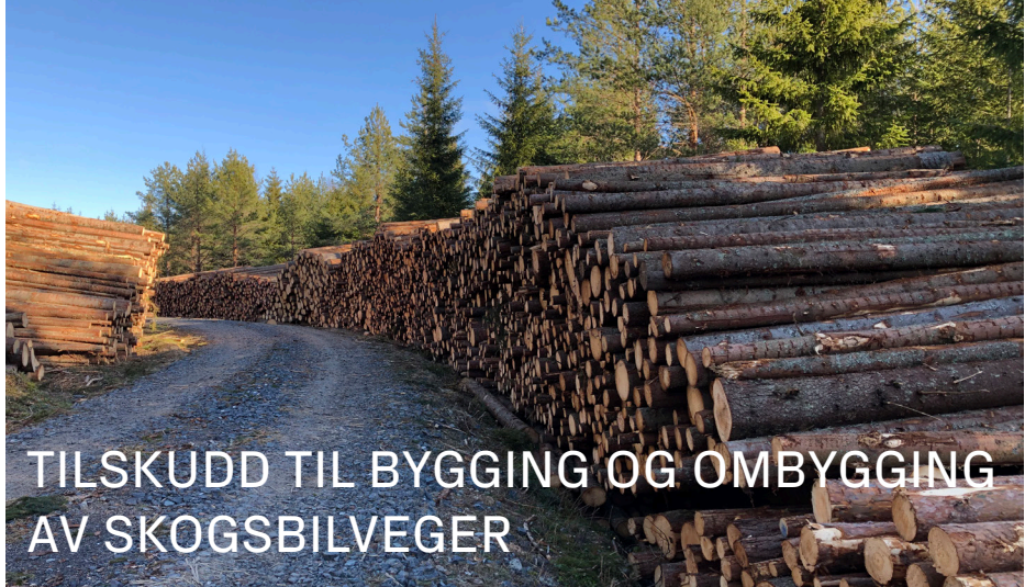
Hentekbart virke etter hogst i vinter, fra Søråm.