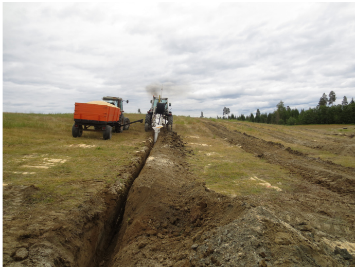
Grøfting i Blaker.

Drenering av jordbruksjord har mange positive effekter, som økte avlinger, bedre jordstruktur og mindre klimagassutslipp. Med et endret klima med flomregn og et mer ustabil vær, så vil systematisk grøfting også kunne redusere avrenning av jordpartikler og næringsstoffer ut i vann og vassdrag.