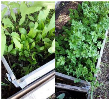
Høsteklar romanosalat og persille.