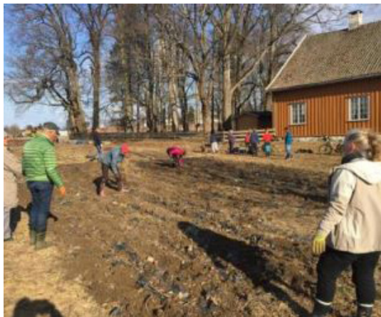
Første felles dugnad ved Husebyjordet andelslandbruk.