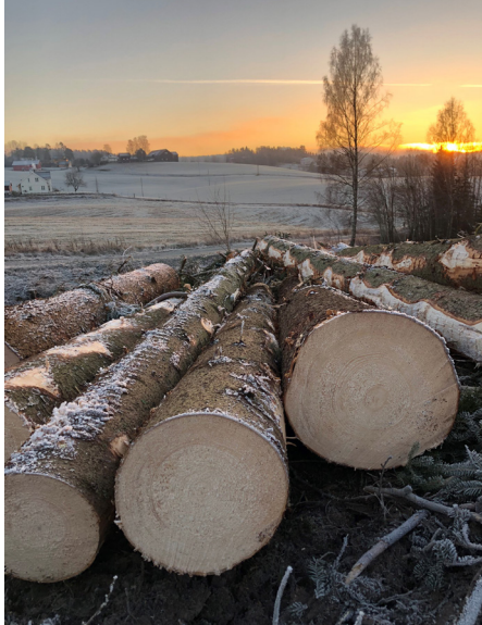
Tømmer i solnedgang. Fra høstens hogst i kommuneskogen ved Tyrhjellen.

Med ønske om en riktig god jul og et godt nytt år!