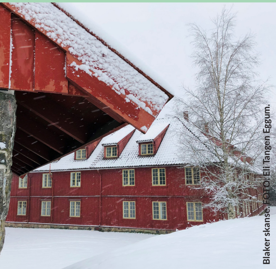
Blaker skanse.

Et informasjonsblad til jord- og skogbrukere i Lillestrøm