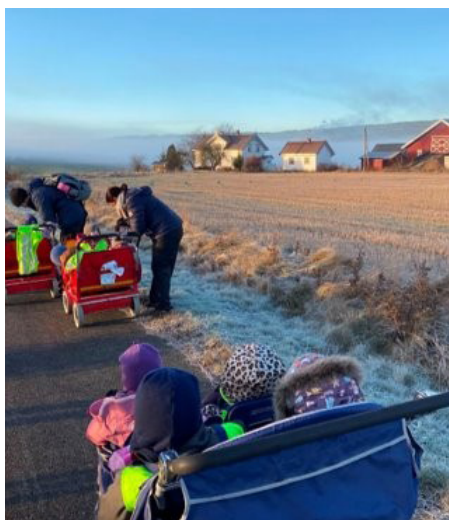
Sørumsand barnehage på jakt etter helten - bonden.

Den siste tiden har de jobbet med biogass. – Kubæsj har vært et brennhett tema etter at vi var på bondegården, fortsetter Smedsrud. En dag kom også spørsmålet om bæsjen kommer ut av juret. Da kom det fra et av barna, som pekte på de ulike spenene på juret: – Det er melk i én, bæsj i én og tiss i én.