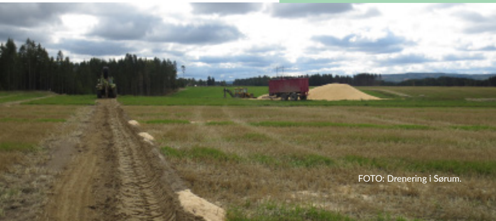
FOTO: Drenering i Sørum.

Mer informasjon om ordningen og faglig veiledning finner du på: Landbruksdirektoratet .