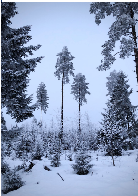
Den kalde, fine tida.

Mer informasjon om registrering av skogskader finnes her .