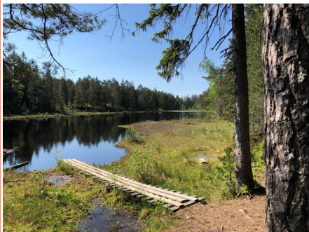
Ringnestjerna juni 2021, Lillestrøm kommune.

Det er utarbeidet retningslinjer for hogst i kantsoner langs vassdrag. Hvordan dette skal praktiseres i forhold til vannressursloven blir oppsummert slik: