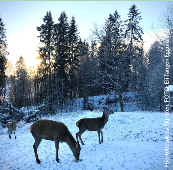
Hjortebesøk på Skjetteen.

Et informasjonsblad til jord- og skogbrukere i Lillestrøm