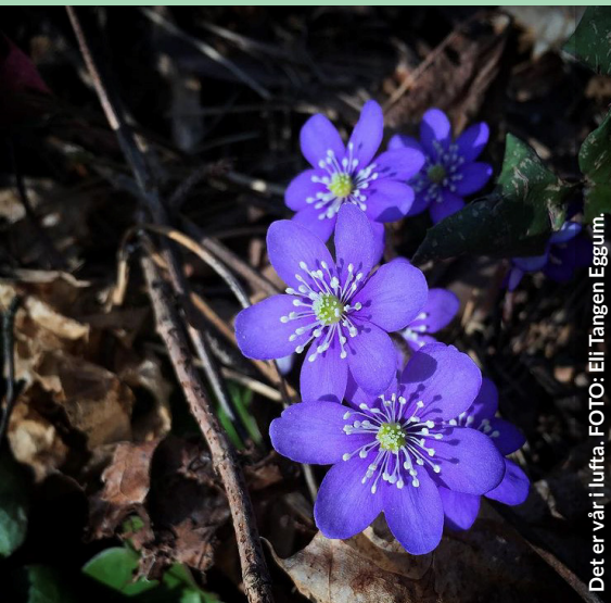
Det er vår i lufta.

Et informasjonsblad til jord- og skogbrukere i Lillestrøm