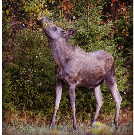
Beitende Ullensakerelg.

Mer info finner du på Lillestrøm kommunes innbyggerportal: www.lillestrom.kommune.no