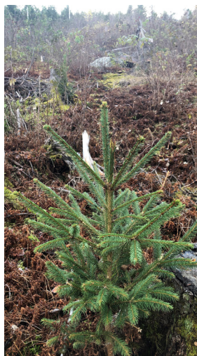
Resultatkartlegging 2021.

TETTERE PLANTING VED SUPPLERINGSPLANTING: Inntil 30 % tilskudd. Les mer om forutsetninger og vilkår, og finn lenke til søknadskjemaet her . Søknadsfrist: 1. september (vår) og 25. november (høst).