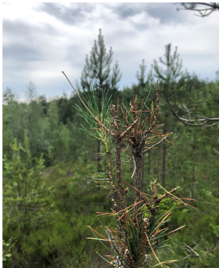
Elgbeiteskade på furu i Lillestrøm kommuneskog.

Det er kun forhold knyttet til elgens beite som blir registrert i dette prosjektet. De som likevel