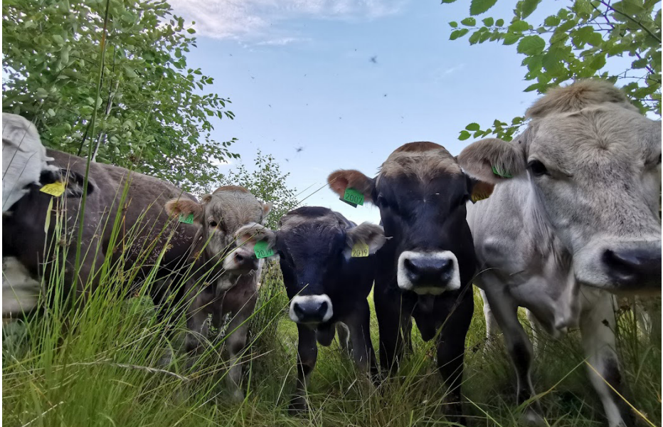
Lykkelige kuer på beite i Gan.