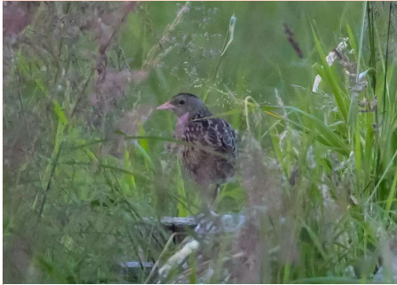
Åkerrikke. FOTO: Øyvind Hagen.