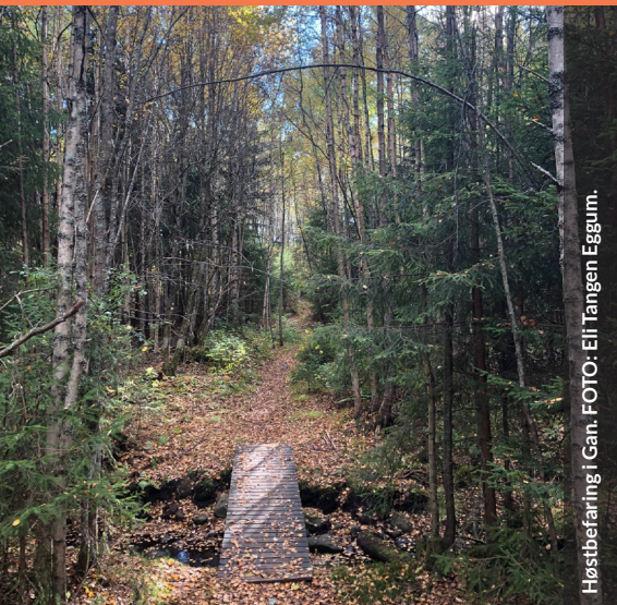
Høstbefaring i Gan.

Et informasjonsblad til jord- og skogbrukere i Lillestrøm