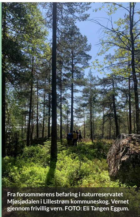
Fra forsommerens befaring i naturreservatet Mjøsjødalen i Lillestrøm kommuneskog. Vernet gjennom frivillig vern.