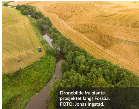
Dronebilde fra plante-prosjektet langs Fossåa.

Kantvegetasjon er svært viktig for vannlevende dyr og fisk da den blant annet skaper skygge og bidrar til å regulere temperaturen i vannet. Trær kan også bidra til å skape skjul for fisk og dyr i vannet. Samtidig er blader, kvist og grener nødvendig næring for insekter og bunndyr som i andre rekke kan være viktig næringsdyr for fisk og andre vannlevende dyr. Kantvegetasjon kan også være viktige leveområder for pollinerende insekter, fugler og annet vilt.