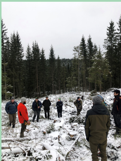
Gruppehogst i Oslo kommuneskog. Her fra høstens kommunalt skogvalterforum med tema lukkede hogstformer.

Hele opptaket med presentasjoner ligger her .