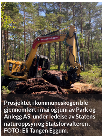
Prosjektet i kommuneskogen ble gjennomført i mai og juni av Park og Anlegg AS, under ledelse av Statens naturoppsyn og Statsforvalteren.

Det meste av restaureringen av myr i Norge har skjedd i regi av Statsforvalter. Lillestrøm kommune og Statsforvalter har i sommer befart flere aktuelle myrer for restaurering i kommuneskogen.