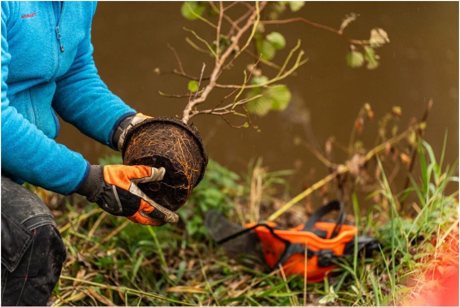
Svartor som plantes langs Fossåa i Blaker.