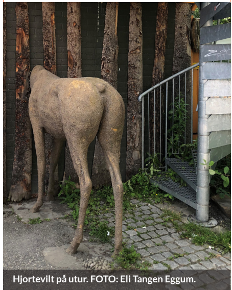
Hjortevilt på utur.

Praktiske spørsmål om bruk av Hjorteviltregisteret eller appen Sett og skutt , rettes til Naturdata på support@naturdata.no eller telefon 743 35 300.