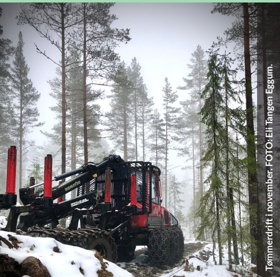
Tømmerdrift i november.

Et informasjonsblad til jord- og skogbrukere i Lillestrøm