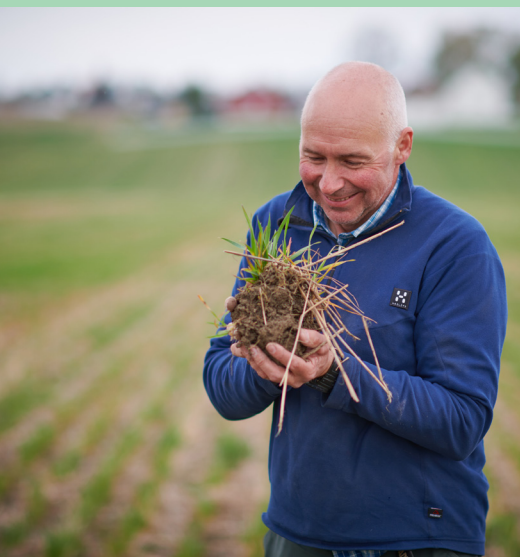
La det spire og gro.

Et informasjonsblad til jord- og skogbrukere i Lillestrøm