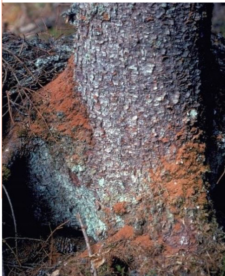
Brunt boremel ved foten av et grantre.

Ta kontakt med avd. landbruk eller din lokale tømmerkjøper for råd.