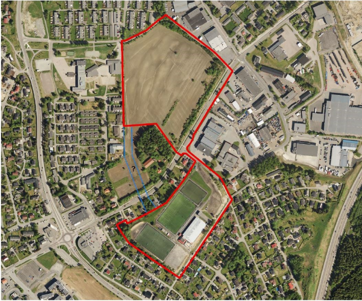
Kartutsnittet viser forslag til varslingsgrense. Varslingsgrensen vil bli utvidet.

Forslagsstiller ønsker at det innenfor planområdet plasseres utendørsbaner, 3 idrettshaller (ishall, fotballhall, «multibygg» for dans, kampsport og turn), tribune (evt. med toaletter, kiosk, garderobe osv.) og områder for egenorganisert aktivitet og rekreasjon.