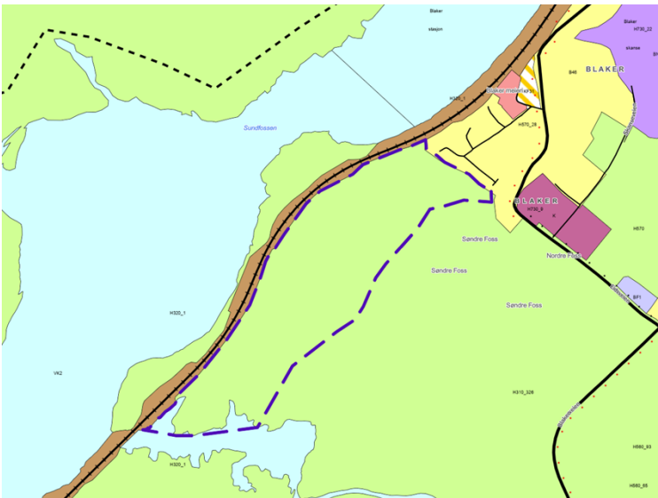
Figur 2.3. Utsnitt av kommuneplanen. Grønn farge illustrerer LNF-formål. Planomriset er vist med lilla stiptet strek. Merk at hensynssoner i kommuneplanen ikke er vist i dette kartutsnittet.

I Kommuneplanens arealdel er området avsatt til LNF-formål med hensynssonene H110_3, som er sikringssone for drikkevann, og H570_28 som er hensynssone for kulturmiljø. Opphevingen medfører ingen endringer av disse juridiske rammene.