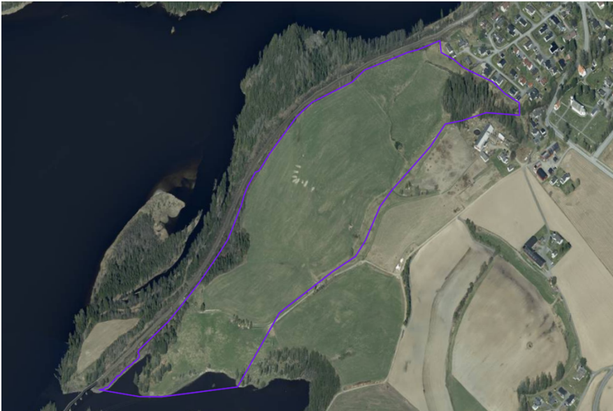
Figur 2.2. Flyfoto over planområdet. Planomriset er markert med lilla strek.