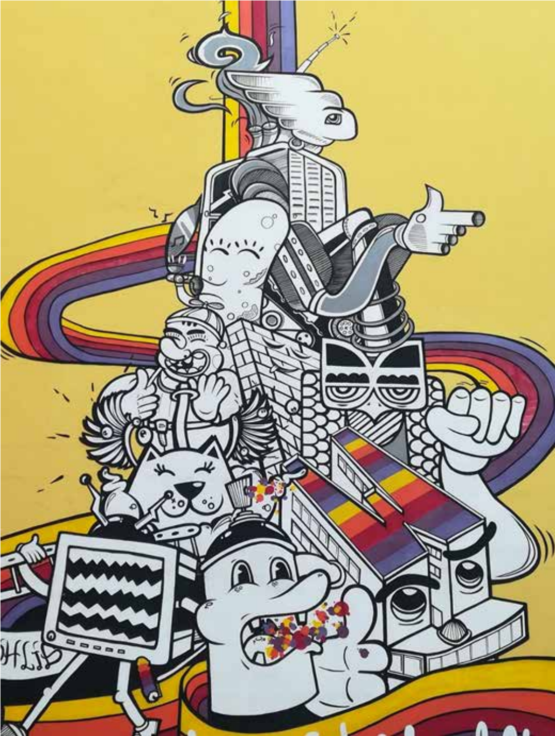
Kreativ kommune, prosjekt støttet av Kulturtanken.