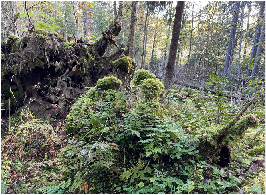
Ravine, Lindeberg.