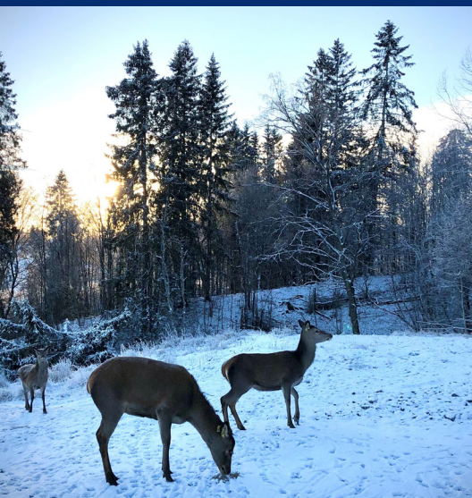
På hjortebesøk.

Et informasjonsblad til jord- og skogbrukere i Lillestrøm