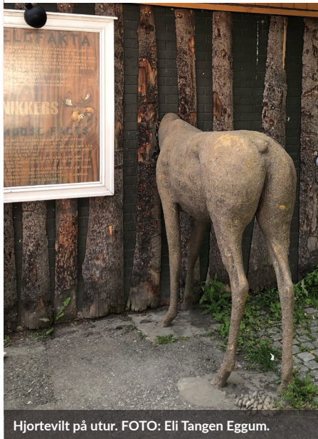
Hjortevilt på utur.

Praktiske spørsmål om bruk av Hjorteviltregisteret eller appen Sett og skutt , rettes til Naturdata på support@naturdata.no eller telefon 743 35 300.