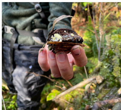
Gul snyltekjuke på Rødrandkjuke.

Program for fagkvelden kommer. Følg med på våre nettsider. Påmelding: odaandrea-gundersen.rolfsjord@lillestrom.kommune.no innen 29. januar.