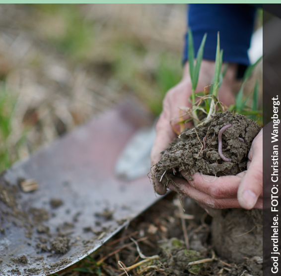
God jordhelse.

Et informasjonsblad til jord- og skogbrukere i Lillestrøm