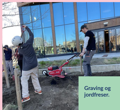
Graving og jordfreser.