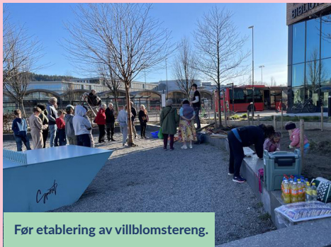
Før etablering av villblomstereng.

Ta deg en tur innom blomsterenga neste gang du er i Lillestrøm sentrum!