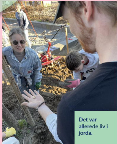
Det var allerede liv i jorda.