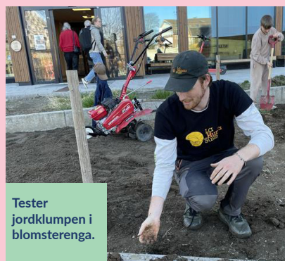
Tester jordklumpen i blomsterenga.