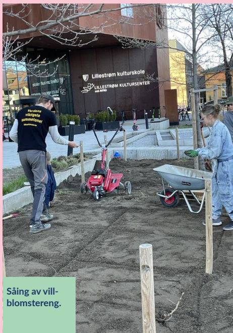
Såing av vill-blomstereng.