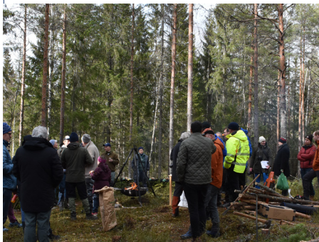
Skogdag for politikere i Lillestrøm og Aurskog-Høland 29. mars 2022, i regi av Østre Romerike skogeierlag.