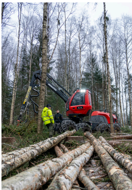
Skjermstilling med bjørk i kommuneskogen.