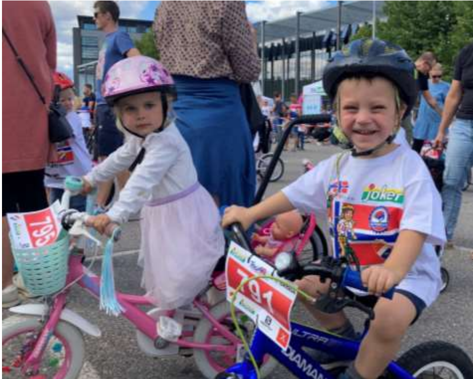
Figur 1 Sykkelglede på Tour of Norway for kids

Bike expo skulle opprinnelig vært arrangert sammen med Camp villmark i juni 2021. På grunn av covid ble expoen avlyst. I stedet ble det arrangert Tour of Norway for Kids og Exporittet 21. august som ett rent utendørs arrangement. Rittene var bra besøkt, med høy idretts glede for små og store. Kommunen deltok med stand på arrangementet og delte ut informasjon om sykkelsetningen.