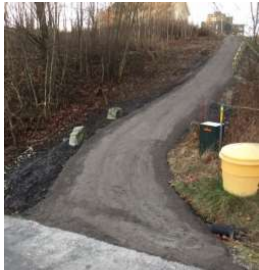
Figur 6 Ny turvei ved Fetsund batteri

Prosjektet kunne bli finansiert med sykkelmidler for 2021 som følge av at sykkelgateprosjektet ble utsatt.