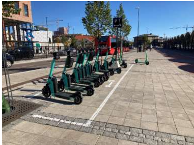
Figur 4 Gateterminalen Lillestrøm

Det er etablert parkeringssoner for elektriske sparkesykkler rundt Lillestrøm stasjon. Dette bidrar til en opprydding av sparkesykkler rundt stasjonen. Det er totalt 3 plasser, med 2 på bysiden og 1 på østsiden av stasjonen. Operatørene koder inn parkeringsbegrensningene slik at det ikke skal være mulig å parkere utenfor disse. Erfaringene så langt høsten 2021 er at dette fungerer svært godt. Det vurderes å etablere slike parkeringssoner flere steder i kommunen.