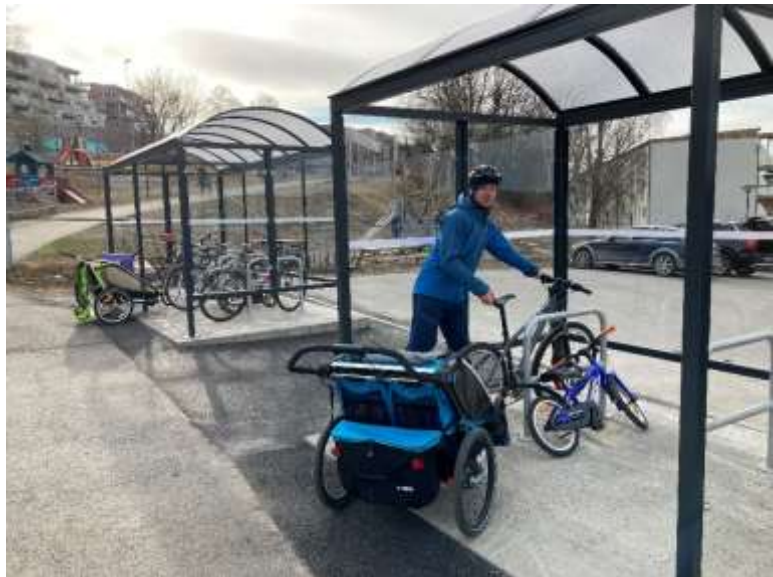
Figur 2 Kjeller barnehage

Prosjektet ble startet opp i 2020 og ferdigstilt i 2021. Prosjektet er finansiert med 2020 midler.