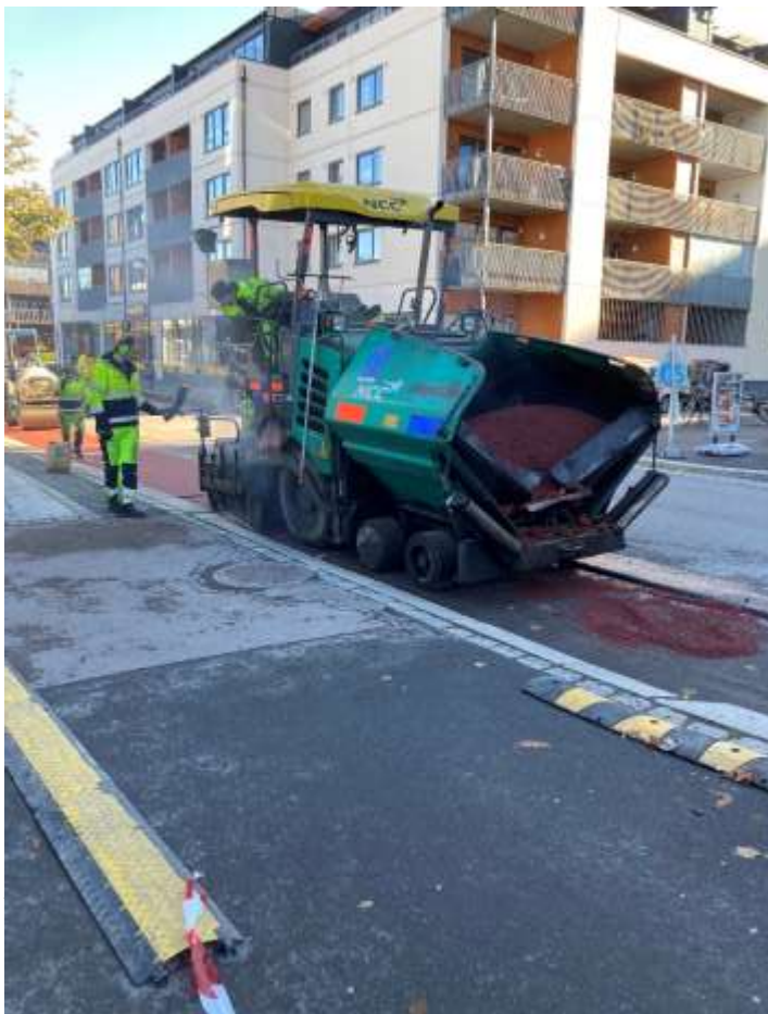
Figur 7 Legging av rød asfalt i Stillverksveien

Sykkelfeltene i Stillverksveien var utslitt, med tidvis dårlig dekke. Mange innkjørsler med stor trafikk gir høy slitasje, og flere steder var det lappet med svart asfalt, slik at sykkelfeltene ikke lengre var sammenhengende røde. Flere gatestein var også løse, og fjernet noen steder. Sykkelfeltene var utført med plexidekk-belegg på asfalt. Produktet har en levetid på 3-5 år, og har vart godt ut denne tiden.