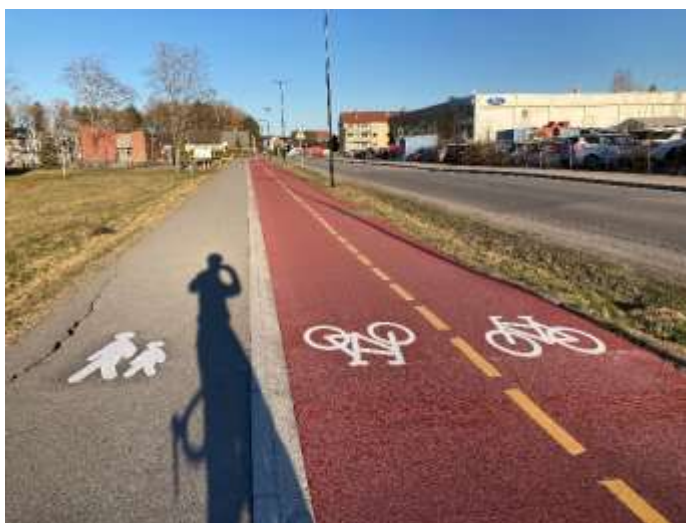
Figur 3 Vestbygata

Eksisterende sykkelvei langs Vestgata er oppgradert med rødfarget dekke og sykkelsymbol. Det er lagt en epoxyblanding på eksisterende asfalt. Tiltaket er i tråd med strategi for at all dedikert sykkelinfrastruktur skal være rødfarget. Dette gjør det enklere for syklister og fotgjengere å skille mellom sykkelvei og fortau.