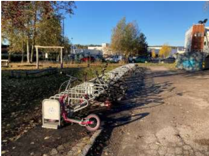
Figur 5 Utvidet sykkelparkering på Vardåsen skole

Dalen-, Sørum-, Sten-Tærud-, Åsenhagen-, og Vardåsen skole og Måsan barnehage fikk oppgradert og utvidet sykkelparkering i 2021. Det var variabelt omfang på prosjektene, fra utsett av mobile sykkelstativ, til etablering av faste stativ. Stativene er alle uten tak. Tiltaket gir flere sykkelplasser ved skolene/barnehagen.