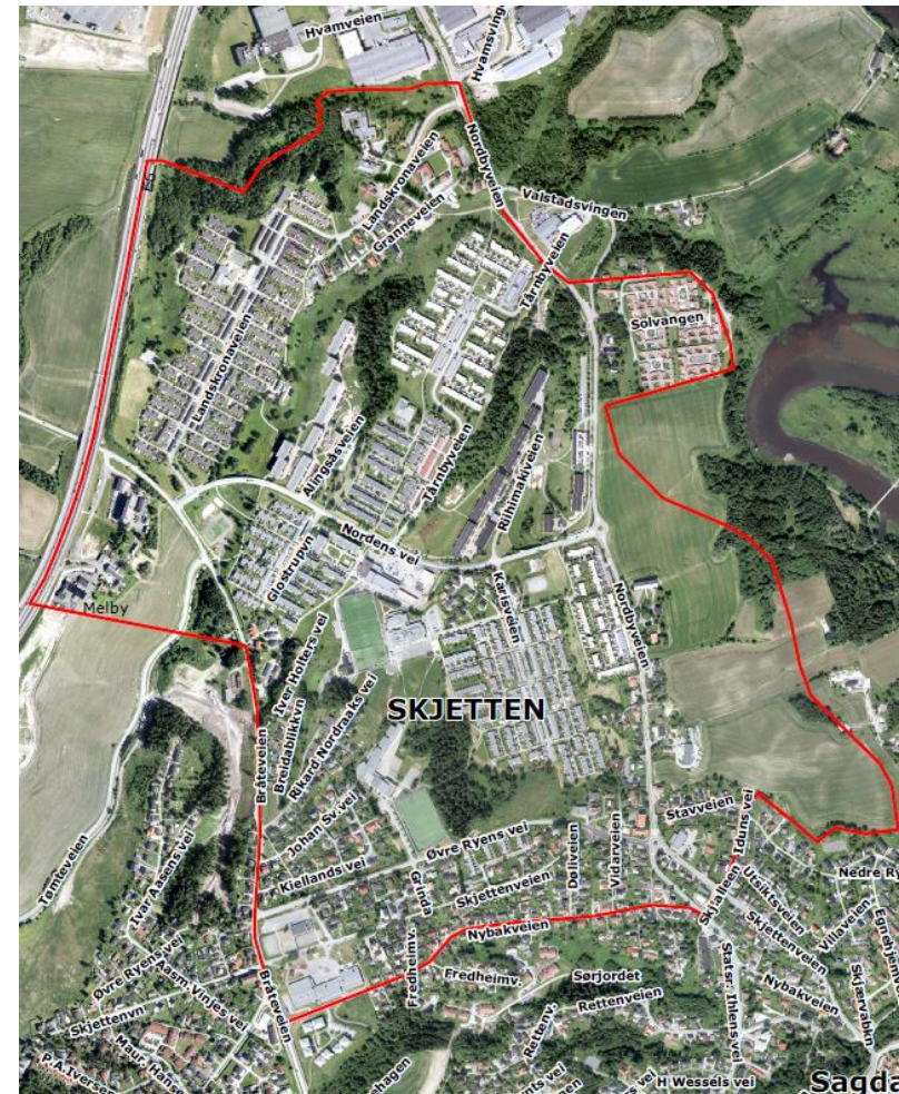
Figur 1 Avgrensning for områdesatsingen i Skjetten

Det er også andre områder utenfor denne avgrensingen som både er en del av Skjetten og som er viktige for beboerne på Skjetten, derfor vil ikke en slik avgrensning være helt absolutt.